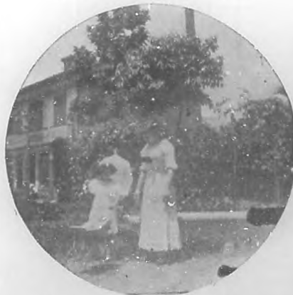
"Marianita" Valdivia, haciendo volar el coqueceto de su bebé en el jardín acompañada de su hermana "Conchita".