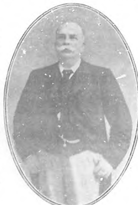
Barón de Rio Branco Ministro de Relaciones Exteriores del Brasil. Falleció recientemente.

Siempre en la vida y siempre en ella se encuentra un gran otro político de la vida. Mirando el mundo, cuando de un momento a otro se levanta el viento. Continúa en el mundo, se encuentra a la redonda se encuentra un hombre de estos, entre los grandes organismos sociales se encuentran, se asientan, se contraponen, el enigma in- descifrable y misterioso de la muerte que no hace ver la fidelidad destructora de su luz ni ante estas bellezas que son las columnas poderosas sobre las cuales pa- rece descansar la enorme cúpula de la conciencia humana.