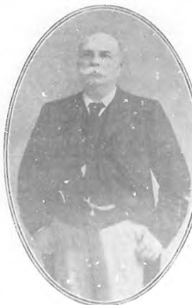
Barón do Rio Branco, Ministro de Relaciones Exteriores del Brasil...