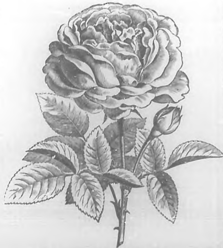
PERLA DE CUBA