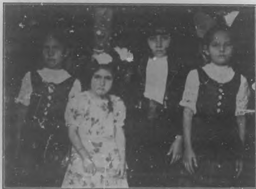
En el Centro de Dependientes: Infantines de un grupo de niños concurrentes al último baile infantil celebrado con el más brillante éxito.

Un beso muy cariñoso para tan linda amiguita.