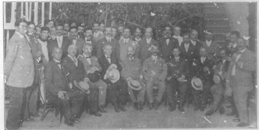
Presidentes del Centro Asturiano, Centro Gallego, Asociación de Dependientes, Casino Español, Secretario del mismo, conde de la Dirección, algunos socios e invitados, después del acto de firmar la escritura de adquisición del terreno en que se alzará el Palacio del Casino Español.