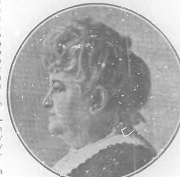
La condesa de Pardo Bazán