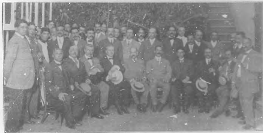
Presidentes del Centro Asturiano, Centro Gallego, Asociación de Dependientes, Casino Español, Secretario del mismo, presidente de la Dirección, algunos socios e invitados, después del acto de firmar la escritura de adjudicación del terreno en que se erige el Palacio del Casino Español.

Recordamos a todos los concursantes premiados en el